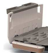
棚ユニット付きボード