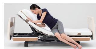
離床動作が可能に

※ 手元スイッチの交換で、3 モーションを 2 モーションに、3 モーターを 2 モーションにして使用することができます。