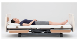
背と膝を同時にあげ

身体能力が残っている方の離床のために、背を上げきらない 40° で、膝が水平になります。