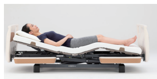
膝 20° で止まり、膝を下げ始める