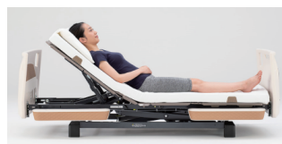
背 40° で膝は 0° になる